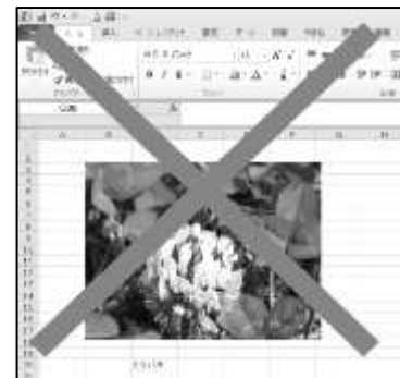
アプリに貼り付けない