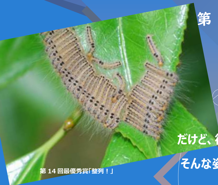
第14回最優秀賞「整列！」