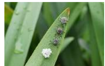
第9回最優秀賞「キマダラカメムシ」